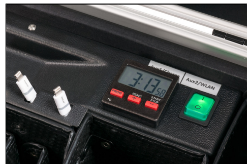
- Sync- und Ladeinheit (Switch On/Off) - programmierbarer, interner Ladetimer